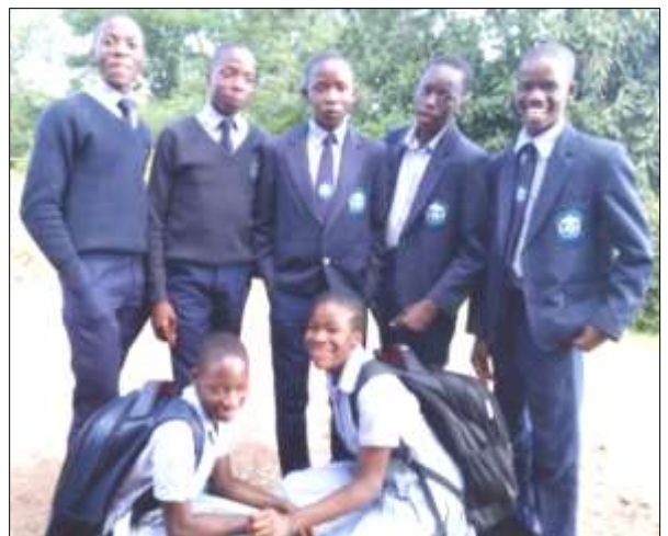
Weitere Mädchen und Jungen vom Kinderheim wurden in diesem Schuljahr in die Mary Ward High School aufgenommen