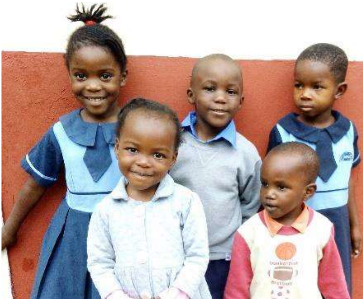
Hier sind 5 Kinder vom Children's Home, die unsere dem Kinderheim angeschlossene Vorschule besuchen,